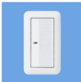
ラウンドプレート